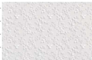
CK3199のパターン写真(1目盛り10cm)